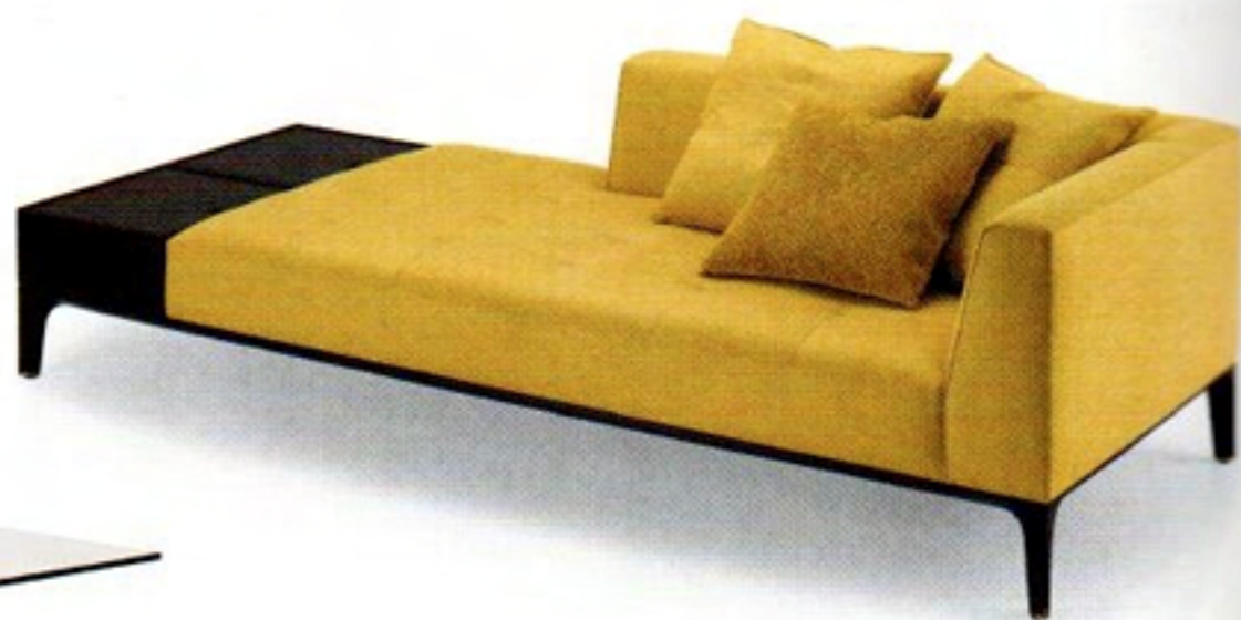
Le «Day Bed» de Giuseppe Casarosa est un beau couchage de repos, disponible en deux différentes dimensions. Structure interne en contreplaqué et base en bois de noyer américain, siège et dossier tapissés en tissu, cuir ou cuir naturel. Patins en laiton et boîte de rangement. CECCOTTI