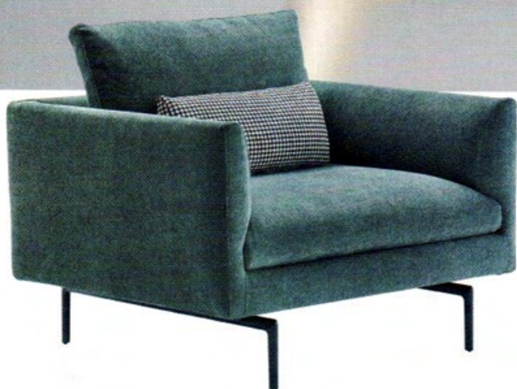
«Flamingo» conçu par Damian Williamson, est un fauteuil avec pieds en alliage d'aluminium poli ou verni noir. Sa structure est en acier. La suspension est assurée par des sangles élastiques et le rembourrage est en polyuréthane/fibre polyester liée à chaud. Le revêtement déhoussable existe en tissu ou en cuir. ZANOTTA